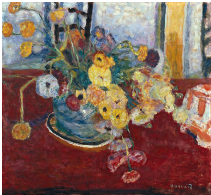
Pierre Bonnard, Fleurs sur un tapis rouge au Cannet, 1928