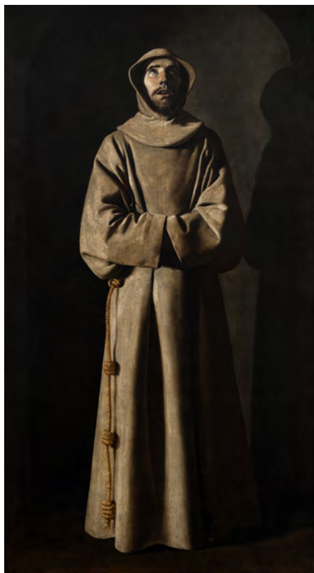
Francisco de Zurbarán, Saint François d'Assise , 1636

Catalunya (MNAC) de Barcelone et au Museum of Fine Arts de Boston. Le sujet de ces œuvres emblématiques participe de leur singularité, au même titre que leur exécution magistrale. Saint François y apparaît tel que le pape Nicolas V l'aurait découvert en 1449 dans la crypte de la basilique d'Assise : debout, les yeux ouverts levés vers le ciel, comme une personne vivante. Présent avant la Révolution dans le couvent lyonnais des Colinettes, sur la colline de la Croix-Rousse, le Saint François du musée des Beaux-Arts de Lyon est la première œuvre de Zurbarán à avoir rejoint les collections d'un musée français, en 1807. L'exposition explore les ressorts et les sources de cette création. Sont ainsi présentés un ensemble de tableaux de Zurbarán en rapport avec le chef-d'œuvre lyonnais, ainsi que des œuvres témoignant du développement de cette iconographie en Europe à la période moderne. L'exposition réunit une centaine d'œuvres créées du XVI e au XXI e siècle, aussi bien des peintures que des sculptures, des dessins, des gravures, des photographies ou des pièces de haute couture.