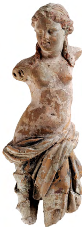
Égypte, II e -I er s. av. J.-C., époque hellénistique